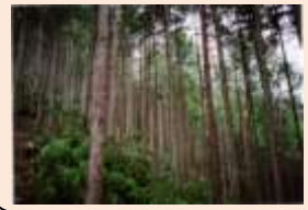
安佐南区沼田町阿戸幸の神