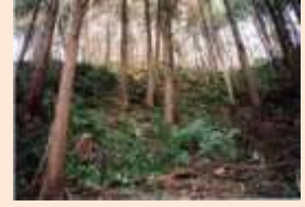
安佐南区沼田町阿戸幸の神