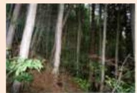
安佐南区沼田町阿戸桑迫