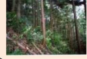
安佐南区沼田町阿戸狼岩