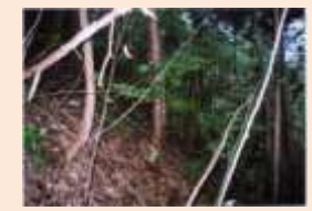
安佐南区沼田町阿戸狼岩