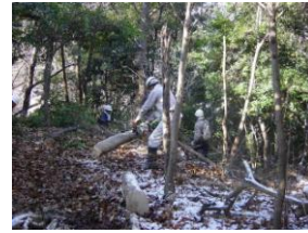
安芸三田炭焼きクラブ