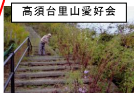
高須台里山愛好会