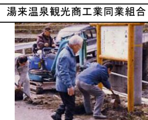
湯来温泉観光商工業同業組合