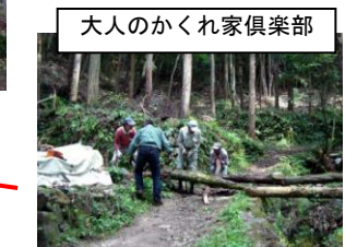
大人のかくれ家倶楽部