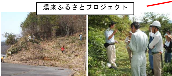
湯来ふるさとプロジェクト