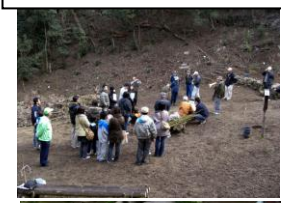
安地区まちづくりプラン プロジェクト