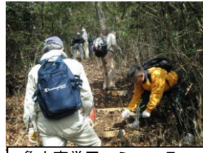
亀山南学区コミュニティ 交流協議会