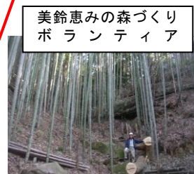
美鈴恵みの森づくり ボランティア