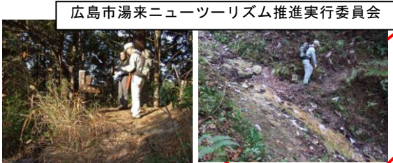
広島市湯来ニューリズム推進実行委員会