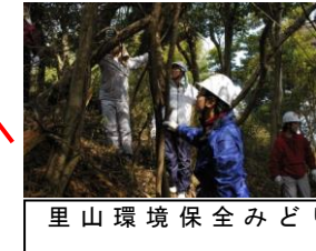
里山環境保全みどり会