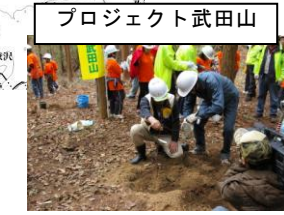
プロジェクト武田山