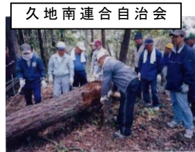
久地南連合自治会