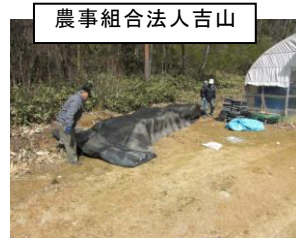
農事組合法人吉山