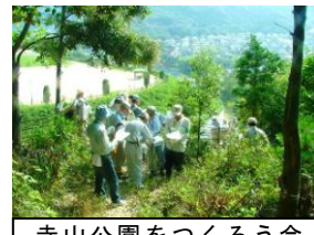
寺山公園をつくろう会