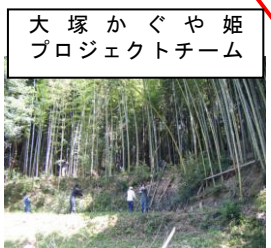
大塚かぐや姫 プロジェクトチーム