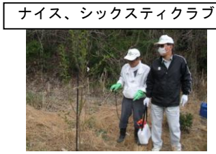
ナイス、シックスティクラブ