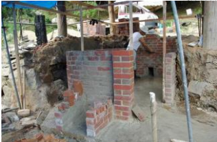
湯来ふるさと探検隊 3回 (65名)