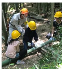
小学生を対象とした竹の伐採指導の様子