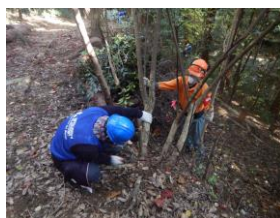
企業の方を対象とした手鋸での伐採指導の様子