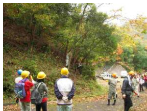
現地での整備助言の様子