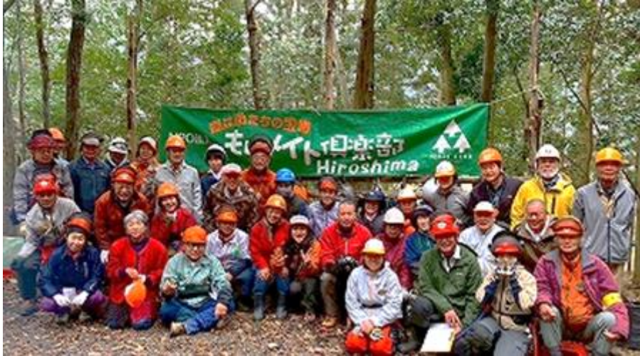
それぞれの研修は充実した学びのひと時に。終えてホッとひと息つきました。

早咲きの桜も咲き始め光は明るさを増し、春の訪れが感じられる当日、天気は午後から雨予報でしたが空も味方して、仕事日和に！