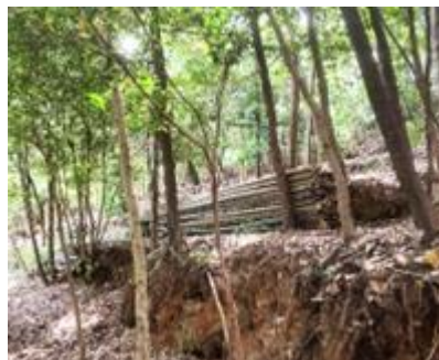
荒れ放題の竹林を整備