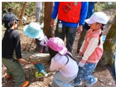
重たいけどそっとホダ木を運ぶよ

昨年度は約80名の方がもりメイトキッズに参加してくれました。本年度も環境保全を主とした「こどもボランティア養成講座」のプログラムを考案しています。お声かけのうえ、一人でも多くの方に参加していただきますよう宜しくお願いします。