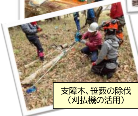
支障木、笹藪の除伐 (刈払機の活用)