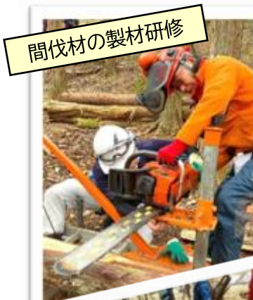
間伐材の製材研修