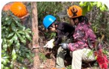
ノコを使って木を切るぞ

★参加人数：16名(5家族)。小学生2名 未就学児6名 保護者8名、スタッフ：13名