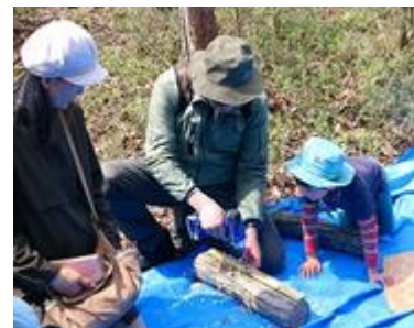
ホダ木にドリルで穴開け作業

子供達たちが一生懸命作業に取り組み、伐採やホダ木運びで協力する姿に心を打たれました。森の中で一日中過ごしても飽きない子供達。保護者への啓蒙も含め、体験から自然を学ぶ最高の環境だと実感しました。