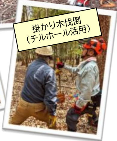
掛かり木伐倒 (チルホール活用)