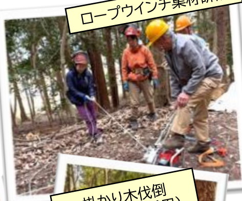
ロープウインチ集材研修