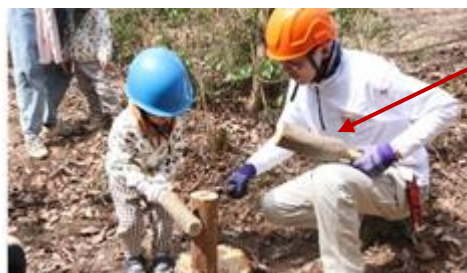
親子で力合わせ木のハンマーで薪わり体験。「えい！やあ！」