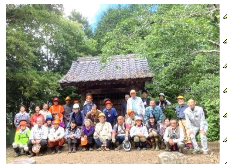
作業を終え琴平山山頂にて；昨年の例会から