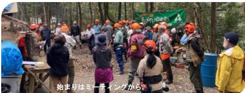
始まりはミーティングから。