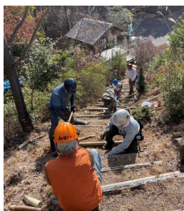
一段ずつ丁寧に補修を重ねる。