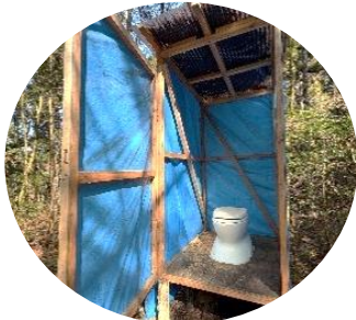
Cフィールドのトイレ

さらに、第4回もりメイトキッズ(3月29日)で行う押し寿司と、薪割りで使用する木のハンマーを試作してみました。大人も子供も楽しめるプログラムにスタッフも胸がぐんぐん高まります。