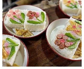
可愛い押し寿司の試作