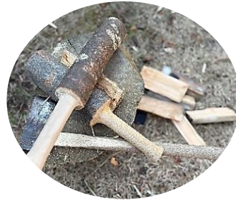
お手製の木のハンマー(川原作)