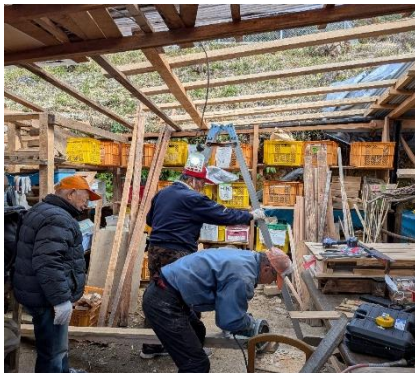
鹿ヶ谷ベース基地の屋根材補強工事

15日に里山部会に参加して、チェーンソー製材機の設置と試運転を行いました。2025年度のクラフト部会参加者は、延べ188名(イベント指導員含まず)の参加があり、朝のミーティングでも、以前とは違い活発な意見交換が出来るまでになり頼もしい限りです。2026年度からは、より多くの倶楽部員の参加を促すため、土曜日・日曜日の2日間の開催を予定しています、気兼ねなくお出で下さるよう期待しています。