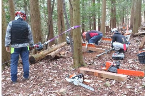
製材治具組み立て