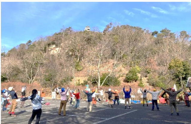
補修の階段を見上げつつ、ラジオ体操で体をほぐす。

階段作りを見たことはありますが、自分でやるのは今回が初めて。まずは、落ち葉を熊手で払って状況を見てから横木が進行方向に直角になるように、左右傾きがないように置いてみました。それから左右の杭(くい)を打って横木と同じ高さにしました。杭を打ち込む時になるべく要らない力を使わないようにハンマーの重さを利用すること、階段になる土をならす時は鍬(くわ)を浅めに入れる事などのコツを教わりました。杭は60センチもある長い木を使うことも初めて知りました。手入れをする前は荒れて危ない階段でしたが、きれいになって気持ち良くなりました。これからは機会があれば階段作りに参加したいと思いました。