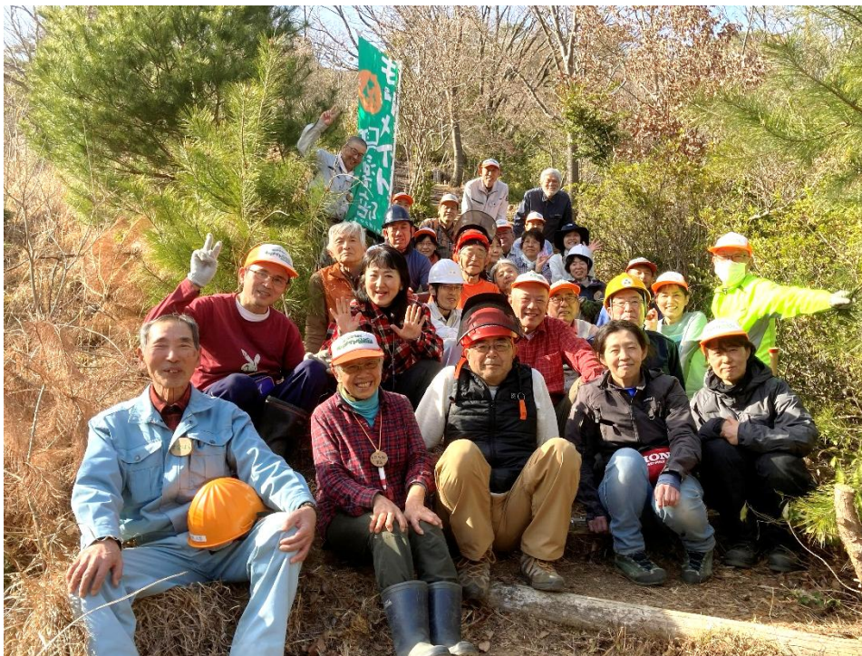
広島市森林公園「鷹の条山」遊歩道(階段)の補修を終えて。オツカレ～！ P3にて報告