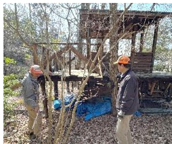
階段の設置場所を思案中