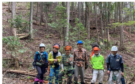
斜面の倒木もきれいに片付けました