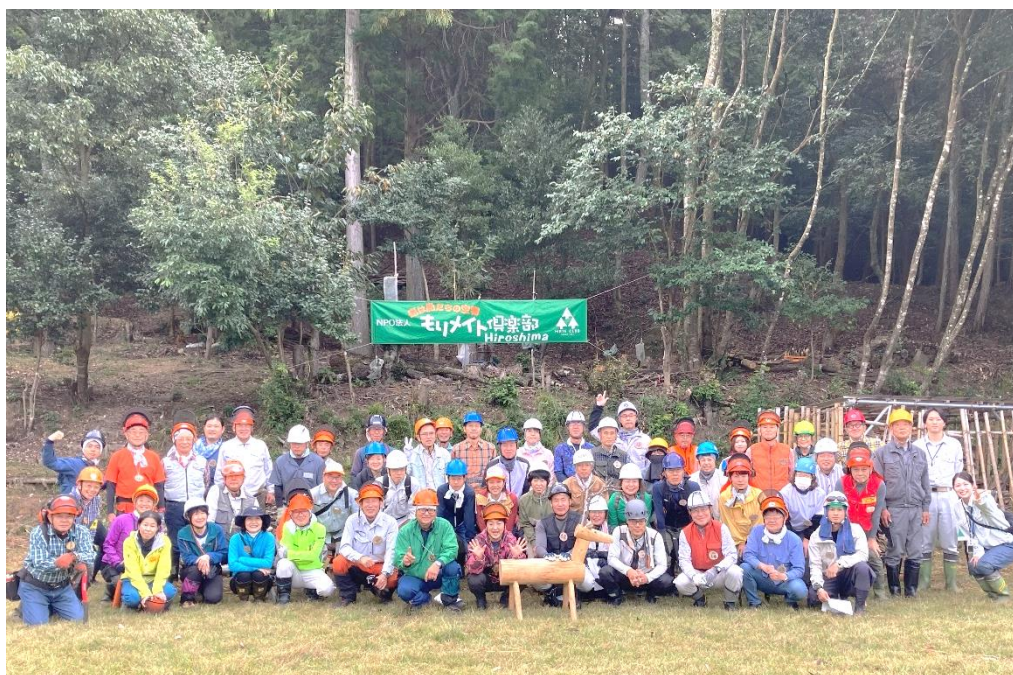
スクウスクウの森での例会。育成講座30期生と共に P3にて報告