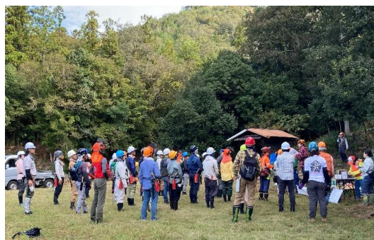
朝のミーティング。一日のスタートは念入りに