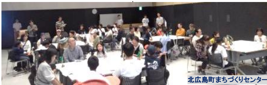
北広島町まちづくりセンター

10月11日(土)北広島町「壬生城址公園」内の町有林を利用してイベントが開催され、倶楽部員6名が関わりました。