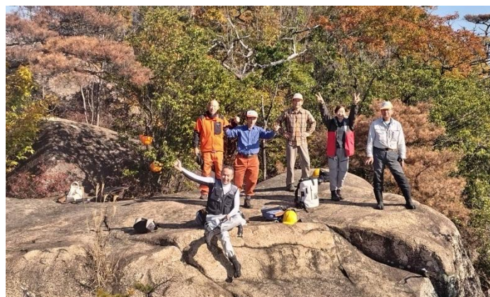
お弁当うまかった！午後からもがんばるぞ～！(昼食後のひと時)