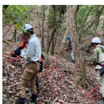
ロープワーク練習中