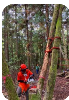
桜に絡んだコナラ伐倒