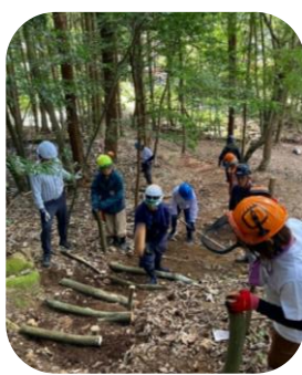
階段作りに励む受講生