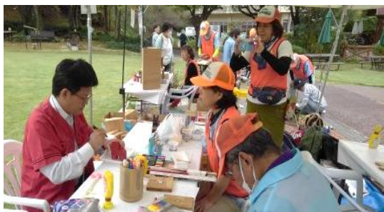
秋のグリーンフェア：干支の馬指導中

■ 澄み切った空に紅葉が映え、美しい季節を迎えています。11月は6箇所でのクラフト体験があり、準備・本番に追われて一番忙しい書き入れ時を迎えました。また、機械の不調もあり直しながらの作業となりましたが、皆、体調管理に気をつけて精力的に作業をこなしていきました。