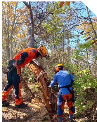
登山道をふさぐ松を倒す。