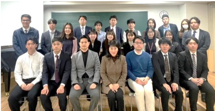
【ローターアクト】の研修に講師として参加