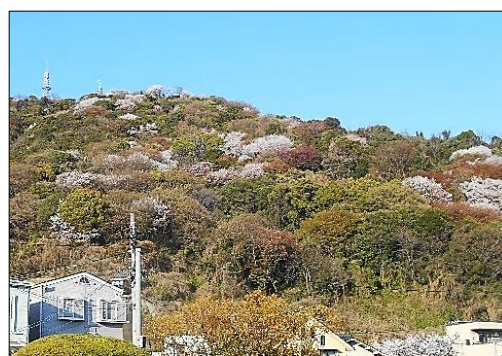
黄金山中腹には何本もの大きなヤマザクラが！（春）

3月例会は16日の第3日曜に安佐北区狩留家にて行います。倶楽部初の取り組みです。ご参加を！