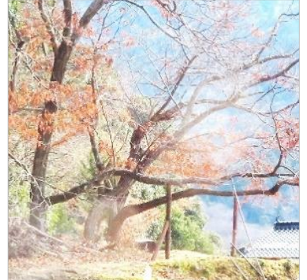
枝を剪定し支柱を立てた栗の木。

今朝は零度。日陰には雪が残っていて本堂の屋根から溶けた雪が落ちてくる。晴れたり曇ったりのお天気だが、風はなく作業が捗る。私は、地域の方々ととんどの準備を手伝う。