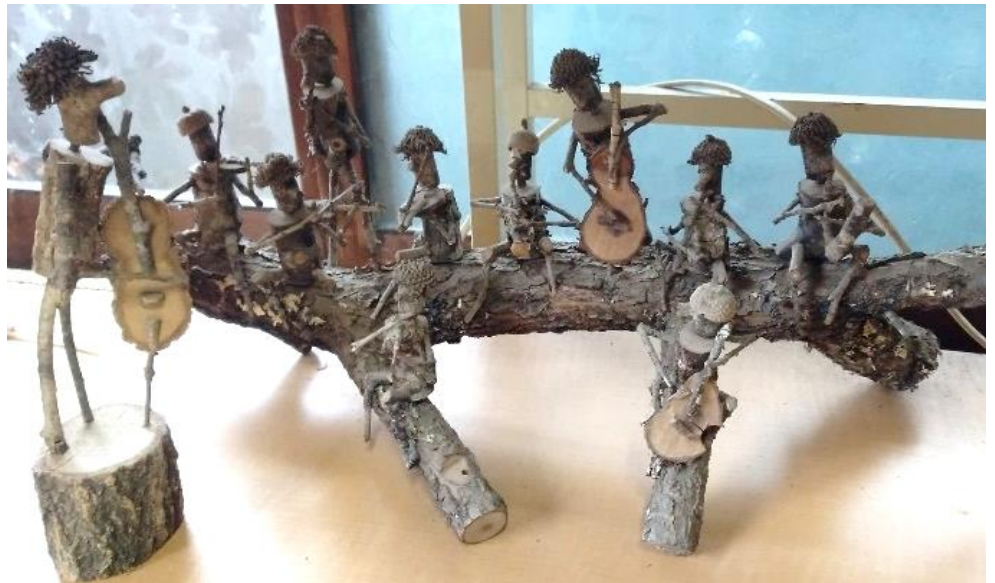
視察ツアー「のんき工房」にて。数ある作品の中から ~P4・5にて報告~

声かけあって 事故を起こさない! 起こさせない! 目指そう 安全・安心・楽しい 森づくり活動を!!