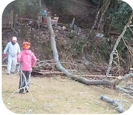
変形したナラ枯れを伐採。ねらい通りに