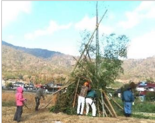
「とんど」やぐらの組み立てを手伝う。