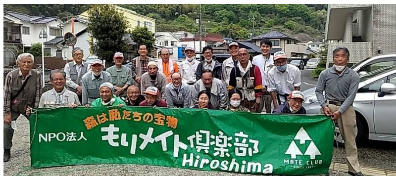
3年前(2022年4月)の集合写真。ほっとひと息、作業を終えほころぶ笑顔。

もりメイト倶楽部は2008年から地元の要請を受けて整備に入っており、近隣の竹害防止活動の取り組みと併せ例会として取り組んでいます。3年ぶりのヤマザクラ、きっと我われを待っていることでしょう。