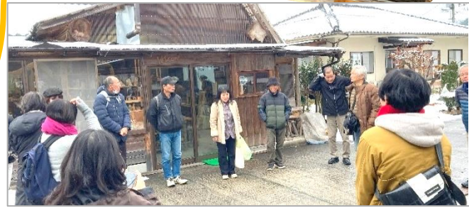
のんき工房到着。まずは、「のんきさん」の話を伺う。 (正面向かって左から4人目、山本理事長右隣り)