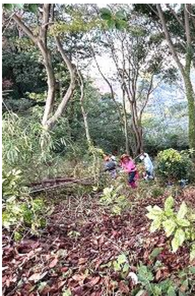
急斜面はロープを用意。伝って登る。

広場に戻って、作業したところを眺めると今まで見えていなかった広島湾の眺望が広がり、作業の疲れが一気になくなりました。よかった！急斜面での作業は、体力も消耗するし、危険が伴う作業となるにもかかわらず、事故もなく、ヒヤリハットもなく完遂できたことは素晴らしいことだと思います。これからも油断せず、楽しい山仕事ができればいいと思います。