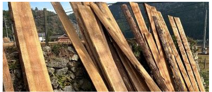
製材されたスギ。ズラリと並びました。

「ひろしまドイツクリスマスマーケット」は、15日にクリッペ(キリスト誕生シーンの情景)を入れるヒュッテ(小屋)の組み立てに4名が係わりました。17日の出店では、雪が舞い真冬日となりましたが、木工クラフト指導に6名が携わりました。この後も、クラフト部会は、23日(土)に大掃除&納会、24日(日)には健康科学館でクラフト指導があり大変忙しい月となりました。12月の参加者52名。