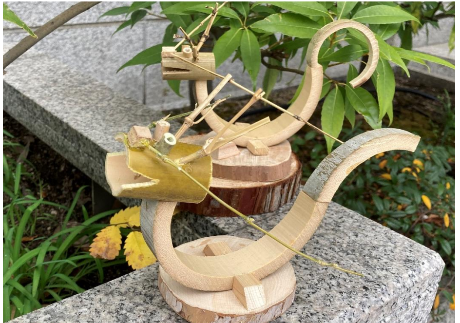
今年の干支「辰」竹を主体にクラフト部会が心込めて創作しました。