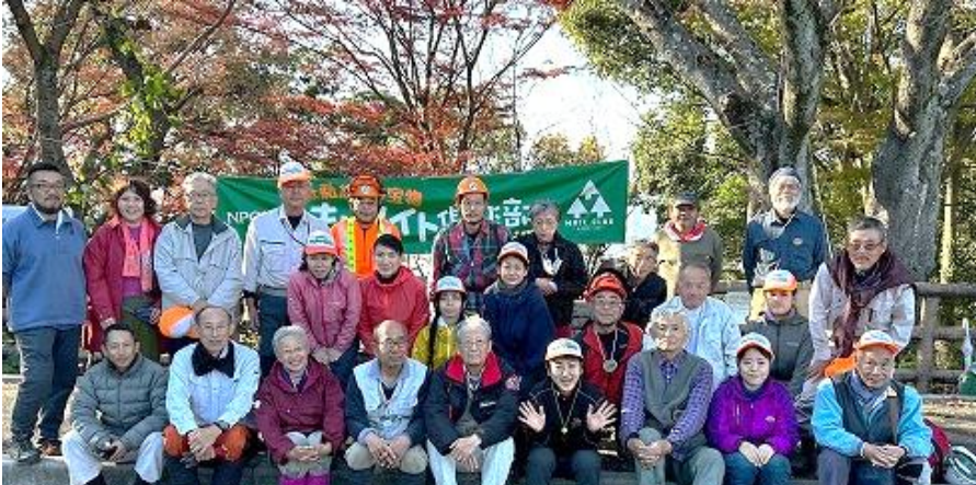
作業を終えて。みなさんお疲れさま。見晴らしがとっても良くなりました！！