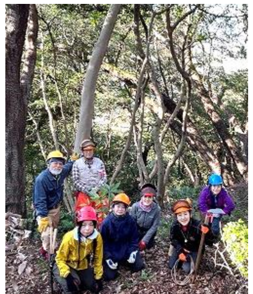
休憩タイム。ニューフェイスが集まりました。