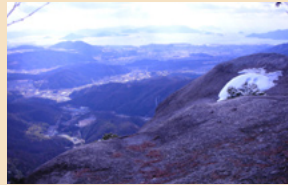
おんな岩からの眺望