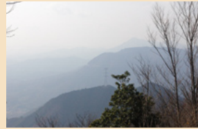
東郷山からの眺望