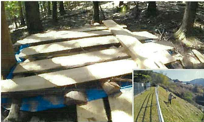
チェーンソーで製材した板。