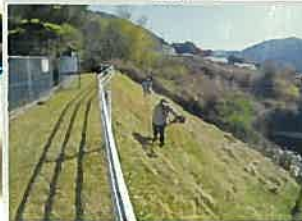
防火水槽・周辺敷地の草刈り