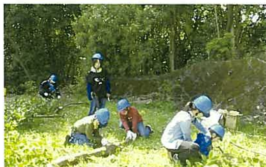
子ども連も参加、除伐した木を整理(H29年)