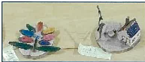
ゆうゆうの作品。木絵(左)と箱庭(右)

4月恒例の「山菜祭り(里山環境保全みどり会)」は中止となりました。今月の一般参加者10人、会員参加数30人。