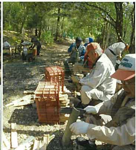
皆で竹林整備で間伐した竹を竹炭用に加工