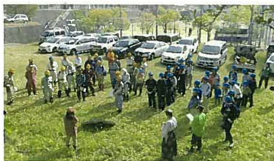
集合場所裏山駐車場にて朝のミーティング(H29年)

6月には総会です。昨年は新型コロナの感染防止に より、表決を委任する(委任状)方法で行いました。 今年は会場も確保しておりますが、状況に応じて変 更します。6月の会報で詳細をお伝えいたします。