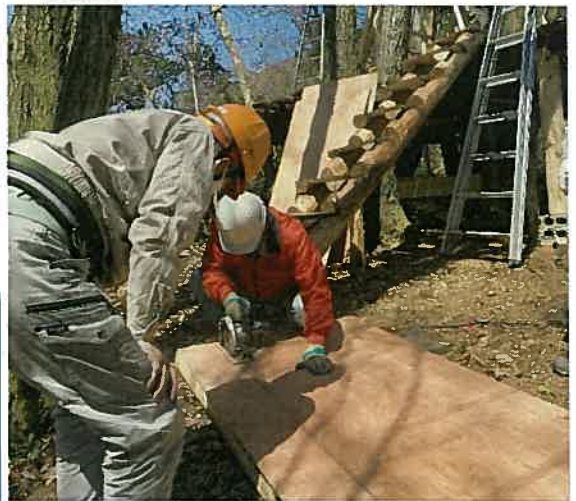
屋根板の切断加工(佐渡、末本)