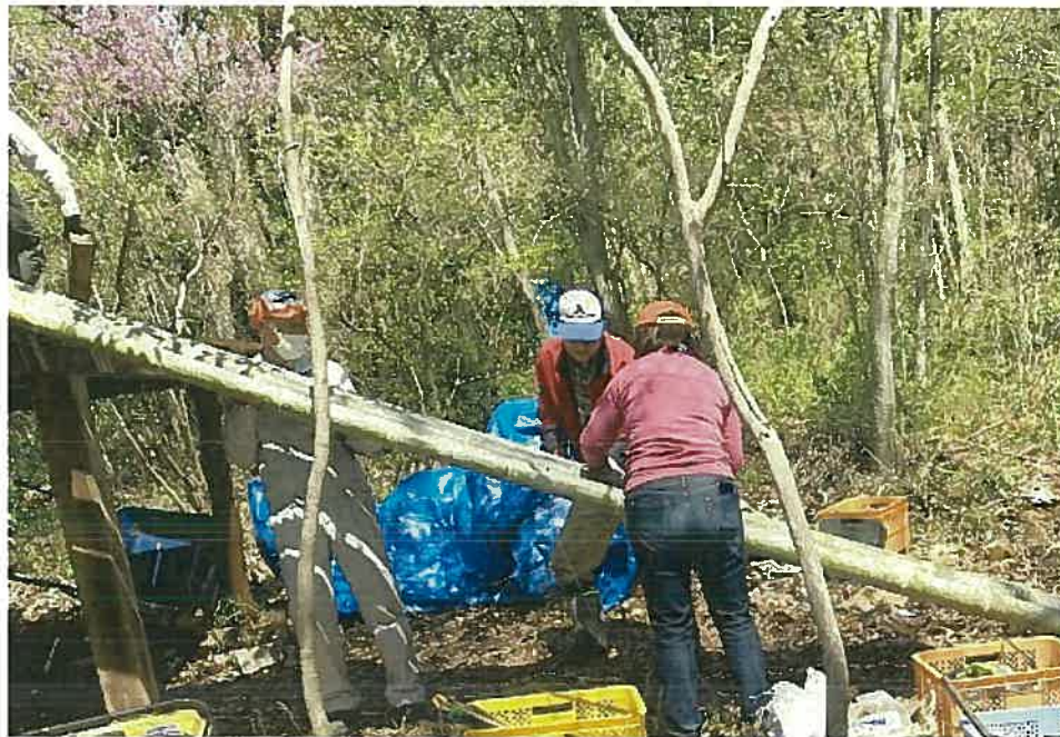
竹のすべり台製作中、樹々が芽吹き始めた松が原キッズフィールドにて。