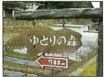
国道69号線道路からの入り口案内板。

誠に残念ですが「ゆとりの森」での例会は延期とし、今後の例会に組み入れ実施していきたいと思っております。