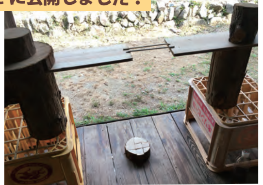
▲事務所縁側での撮影風景。

イベント等で木工品に見て、 触れていただく機会が減った ため、イメージ動画を撮影しまし た。撮影は事務所の縁側で、ビー ル箱と丸太と板と割りばしを組 み合わせた手作り感あふれる撮 影機材(すべて無料)で行いま した。ぜひチャンネル登録いた だけたらうれしいです♪