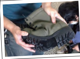
▲すごく曲がります。