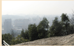
奥院の奥の大岩からの展望