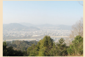
牛田山からの眺望