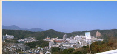
コース上から神田山を望む