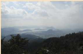
バクチ岩からの眺望